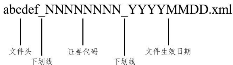
图 3：ETF 定义文件/确认文件/公告文件文件命名规范（xml 版）