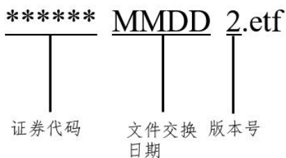
图 2：ETF 公告文件命名规范（2.1 版）