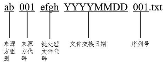
图 1：ETF 定义文件/ETF 确认文件命名规范（2.1 版）